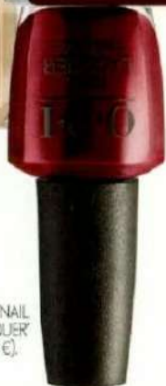
O.P.L. 'NAIL LACQUER' (16,95 €).

La revolución capilar viene de la mano de Sisley y su cura en forma de un bálsamo capaz de reestructurar la fibra. Aplícalo en medios y puntas y déjalo actuar toda la noche mientras duermes, el efecto 'wow' (hidratación, suavidad y brillo) está asegurado.