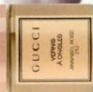
GUCCI 'VERNIS À ONGLES ANNABEL ROSE 212' (24 €), EN NET À PORTER.